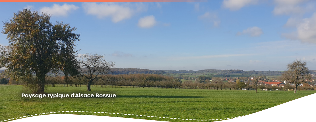
Paysage typique d'Alsace Bossue