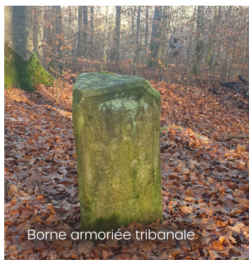
Borne armoriée tribanale